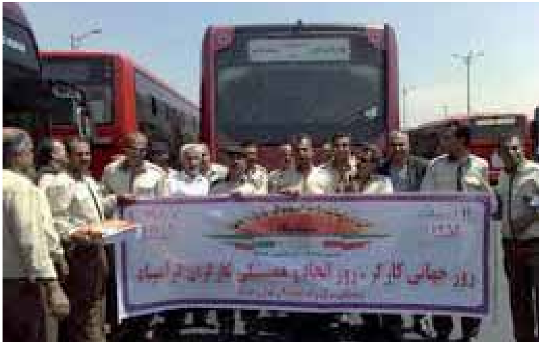
سندیکای کارگران شرکت واحد اتوبوسرانی تهران و حومه