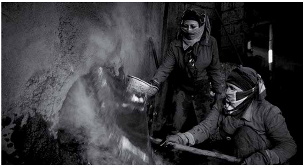
زنان کارگر

همان طور که پیشتر ملاحظه شد، درصد بزرگی از زنان کارگر- بنا به برآوردها بیش از ۷۰٪ - ناچار هستند «قراردادهای سفید امضا» را بپذیرند و در نتیجه از حقوق قانونی خود محروم می شوند. ۸۲ در مقایسه ۳۰٪ از کارگران مرد قرارداد سفید امضا منعقد می کنند. ۸۳ زنان اغلب در کارگاه های کوچک با کارکنان کمتر از ۵ یا ۱۰ نفر شاغل هستند. همان طور که پیشتر خاطر نشان شد، قانون کارگاه های کمتر از ۵ نفر را از بیمه اجباری کارگران معاف کرده است و در مورد کارگاه های کمتر از ۱۰ نفر، معافیت آنها از بعضی از مقررات قانون کار، کارگران را از بخش قابل توجهی از حقوقشان محروم کرده است.