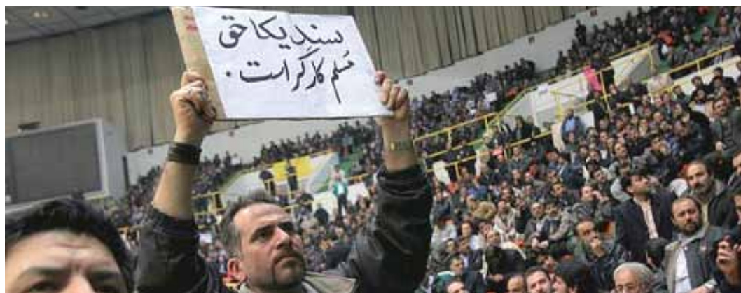
منبع عکس: خبرگزاری فارس

این نهادهای بالاتر را دولت برای نظارت بر تشکیلات محلی تاسیس می کند و آنها به تصمیم گیری در باره تمام امور مهم در سطح کشور می پردازند و «کلیه نمایندگان رسمی کارگران جمهوری اسلامی ایران ادر مجامع و نهادی مختلف از جمله [سازمان جهانی کار را انتخاب می کنند]. ۱۰۹ بر اساس ماده ۱۳۸، «مقام ولایت فقیه در صورت مصلحت می توانند در هر یک از تشکلهای مذکور نماینده داشته باشند»، که باز مداخله مستقیم حکومت در این تشکیلات است.