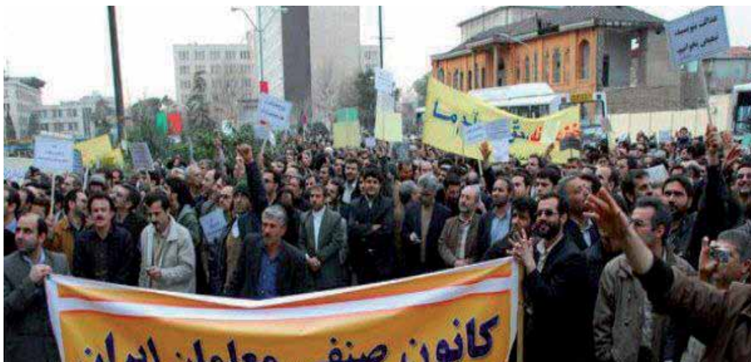
تظاهرات کانون صنفی معلمان ایران