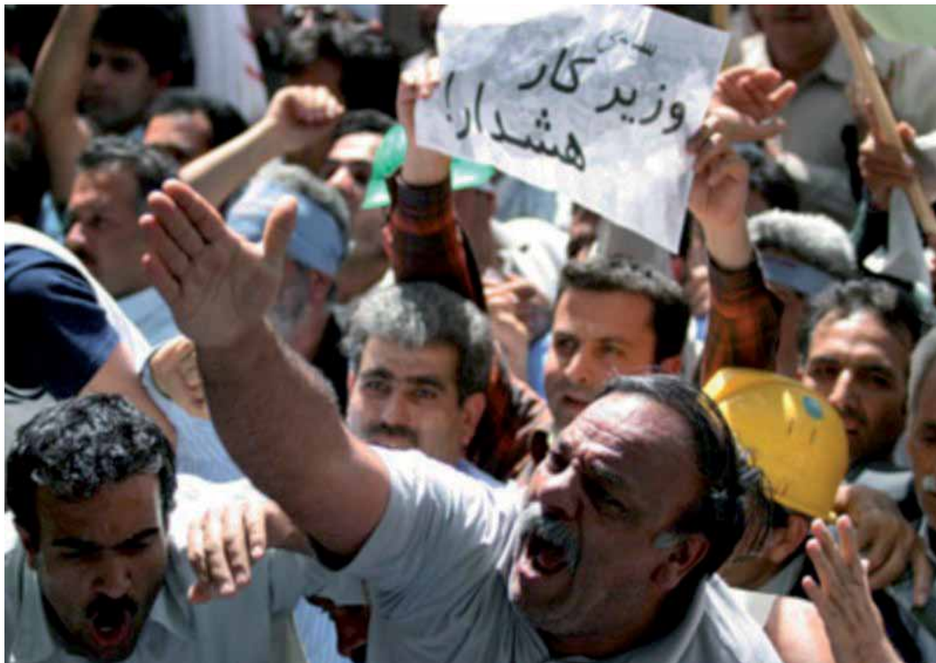
کارگران ایران خواستار پرداخت مزدهای معوقه هستند.

کمیته حقوق اقتصادی، اجتماعی و فرهنگی سازمان ملل در سال ۱۹۹۳ رعایت تعهدات ایران بر اساس میثاق را مورد رسیدگی قرار داده و به تعدادی از موارد نقض جدی حقوق بشر اشاره کرده و پیشنهادهایی به دولت ایران ارایه کرده است. همان طور که در گزارش حاضر مشاهده می شود، متأسفانه، این پیشنهادها به اجرا گذاشته نشده و مورد توجه قرار نگرفته اند.