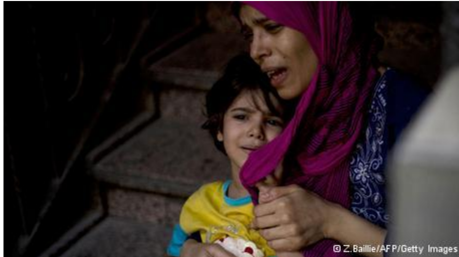
حمله شیمیایی در سوریه

بنیاد آرمان شهر یک نهاد مستقل و غیرانتفاعی شهروندی است که به هیچ دسته اقتصادی، سیاسی، مذهبی، قومی، و هیچ دولتی وابستگی ندارد. آرمان این نهاد ایجاد بسترهای مناسب برای تامین خواستهای اجتماعی برای دموکراسی، حقوق بشر، عدالت و قانون مداری است و نیز دست زدن به ابتکارات فرهنگی و نشر کتاب در خدمت به شکل گیری آگاهی جمعی شهروندان. بنیاد آرمان شهر در راستای تبادل اندیشه و گفتگو در قلب آسیا با هدف ایجاد همبستگی، پیشرفت و صلح، می کوشد. بنیاد آرمان شهر عضو فدراسیون بین المللی جامعه های حقوق بشر (FIDH) است. armanshahrfoundation.openasia@gmail.com تماس با ما: