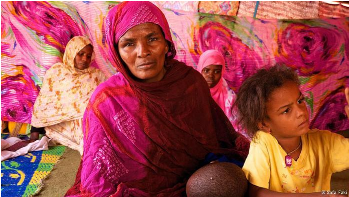
عکس: برده داری در موریتانی - Safa Faki